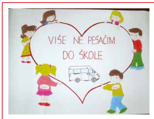
Crtež učenika Osnovne škole „Mirko Tomić“ iz Varvarina