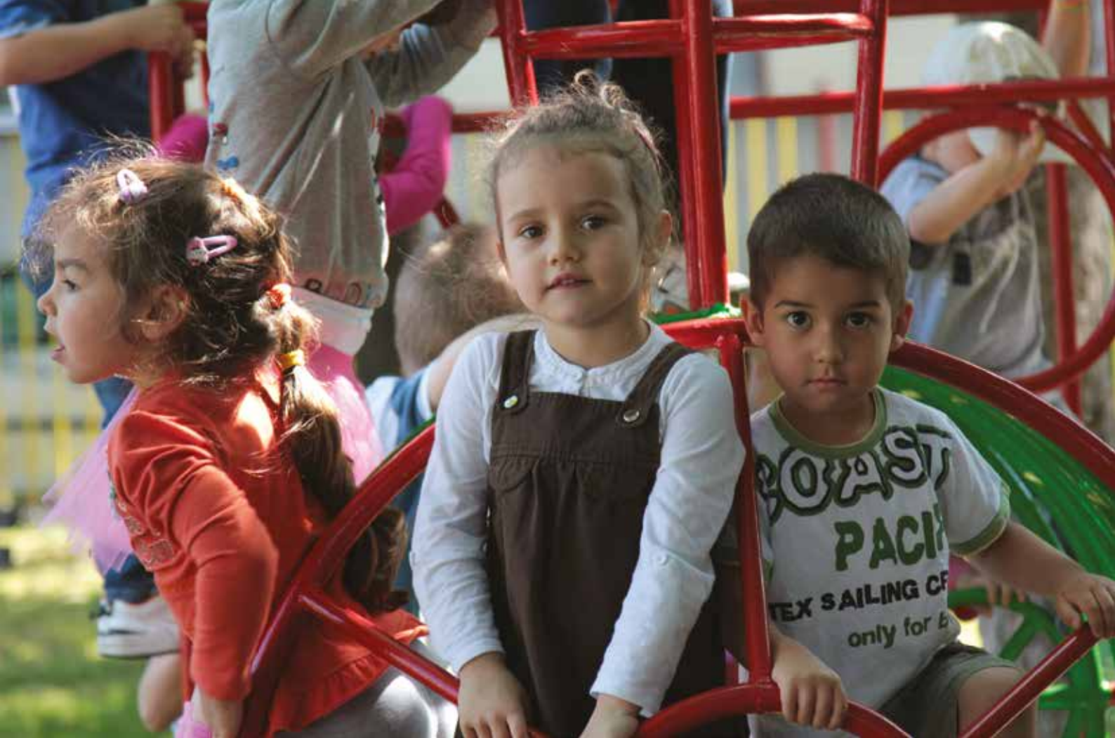
Nagrađena fotografija na konkursu - deca iz vrtića „Mrvica“ Novi Sad